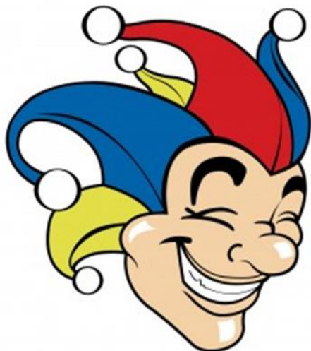
Les Fous du Roi

Sentier de l'épouvante Jean Coutu Jonquière